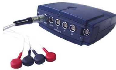
Abb. Biofeedbackgerät „Nexus 10“

Gesundheit zu bewerten, messbar durch moderne Biofeedbackgeräte.